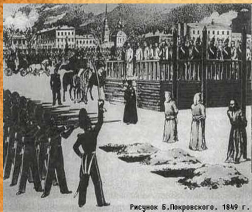
Рисунок Б.Покровского. 1849 г.

Военный суд признал Достоевского «одним из важнейших преступников» и обвинив его в преступных замыслах против правительства, приговорил к смертной казни.